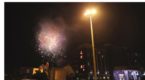
晚7:00整,伴随着倒计时特效烟花的升空,天欣焰火晚会正式拉开序幕。整台焰火晚会共分为四个章节,分别以“漫天花雨庆元宵、创新发展展平安、万众一心再铸辉煌、难忘今宵祝福明天”为主题。

三、提升方面:公司对外形象的提升、员工综合素质的提升。今年各分公司人力资源部要制定具体、细致的培训计划,先认真做好员工岗前培训、基层班组长培训、安全生产管理培训、营销人员培训、中层骨干管理培训,必要时,让部分管理人员接受外训。通过培训,提升相关人员的管理水平和管理能力。同时,加强企业文化建设。实践表明,加强企业文化建设,积极开展廉洁文化、安全文化、服务文化、质量文化、项目文化等文化建设,有助于增强企业核心竞争力,有助于促使企业使命、愿景、核心价值观的进一步清晰,有