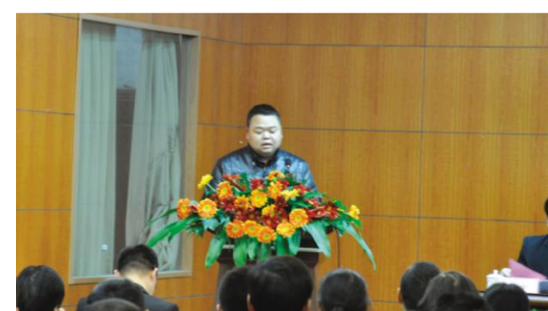
优秀员工代表发言。

二、效益方面:是以结果为导向,以企业利润最大化为目标和宗旨。今年,我们要提高效益,首先是技术部,产品在花色、品种、新产品开发上要与时俱进,推陈出新;生产等部门通力合作完成好全年的营销目标任务。关于今年的营销目标任务重担落在我们全体营销人员肩上。同时王五星董事长对我们的营销团队作出了具体要求:加强自身学习,提高营销业务水平。希望全体营销人员时刻加强自身对行业知识的学习,提高业务水平,掌握新的技能,努力做到有